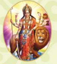
શ્રી કુળદેવી ચામુંડા માં