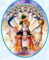
જય શ્રી કૃષ્ણ