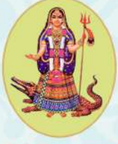
શ્રી જોડીયાર માતાજી