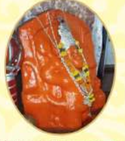
શ્રી ઉચડીયા હનુમાનજી

હેમાદ્રી : સંવત ૨૦૭૮ ચૈત્રસુદ ૩ને સોમવારને તા. ૦૪-૦૪-૨૦૨૨ સવારે ૭-૩૦ કલાકે.