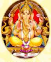
શ્રી ગણેશાય નમઃ