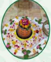
શ્રી જાળેશ્વર મહાદેવ