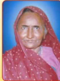
સ્વ.રૂપાબેન દામાભાઈ ભુત